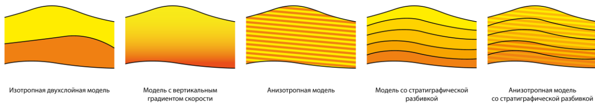
Рисунок 2 Типы расширенной параметризации модели пласта.

Обо всех перечисленных расширенных параметризациях, кроме последней, мы уже много раз рассказывали, поэтому сейчас остановимся на последней из них и расскажем о способе отыскания её параметров – нелинейной томографии.